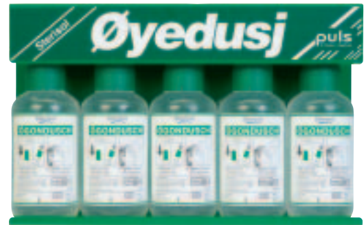
Sterisol veggfeste Veggstativ med 5 flasker 1245