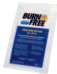
BurnFree kompress 20 x 20 cm 94377BF