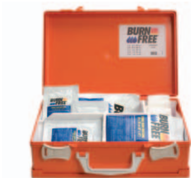
BurnFree brannskadekoffert med kompresser og gasbind 91144